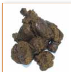
Geformter Kot, sehr weich