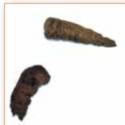
Geformter, trockener Kot, nicht hart